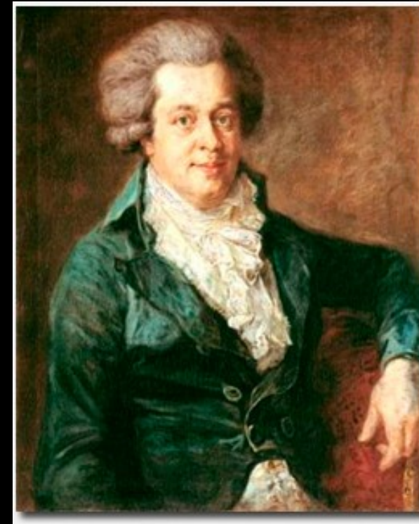
Mozart en 1790.