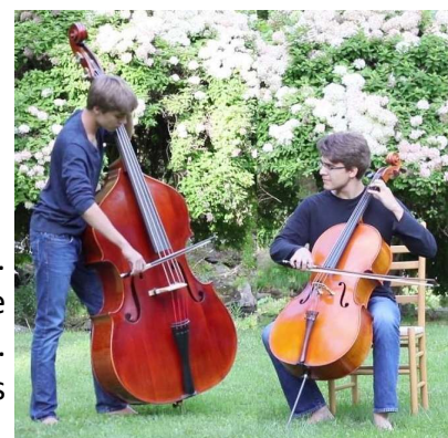
CONTREBASSE ET VIOLONCELLE

Une mélodie est une suite de notes que l'on peut généralement chanter. Quand elle est au premier plan, on l'appelle le thème . Ce qui donne le rythme et le caractère au second plan s'appelle l' accompagnement . Remarquez la différence entre l'accompagnement du thème la première fois et la deuxième dans ce morceau.